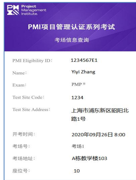
(图二 考场信息查询界面)