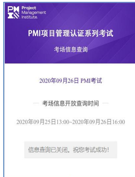
(图四 信息查询已关闭)